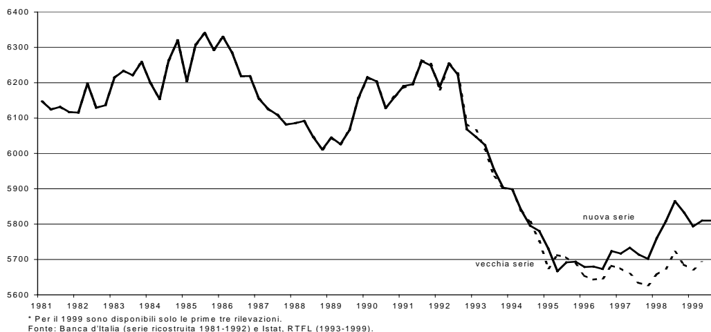
Andamento dell'occupazione nel Mezzogiorno (migliaia di persone, dati trimestrali destagionalizzati) 1981 - 1999*

La struttura produttiva del Mezzogiorno è caratterizzata ancora da una forte debolezza strutturale. Nel confronto con il resto d'Italia è infatti maggiore - e in assoluto ancora elevato - il peso del settore agricolo (nei dati più recenti dell'Indagine sulle forze di lavoro, il 9,4% delle persone occupate, contro il 5,4% della media nazionale); l'industria manifatturiera è pari al 23,5% contro il 32% della media nazionale; è forte il peso di servizi privati a bassa produttività; stante anche l'inferiore livello di occupazione nell'area è più elevata l'incidenza degli occupati della Pubblica Amministrazione, che talvolta ha anche assolto un ruolo improprio di sostegno dei redditi. Anche nel confronto europeo, la peculiarità della struttura produttiva del Mezzogiorno emerge in tutta evidenza.